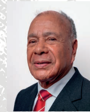
Líder Nacional del Partido del Trabajo

Sen. Alberto Anaya Gutiérrez Sen. Ana Karen Hernández Aceves Sen. Geovanna Bañuelos de la Torre Sen. Lizeth Sánchez García Sen. Yeidckol Polevsky Gurwitz Sen. Alejandro González Yáñez